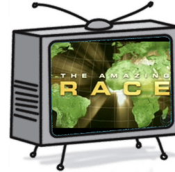
El programa de vida real Reality Show