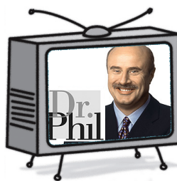
El programa de entrevistas Talk Show