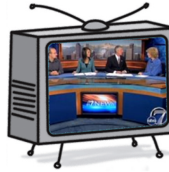
El programa de noticias