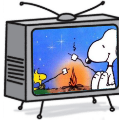
El programa de dibujos animados Cartoon