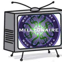
El programa de concursos Game Show